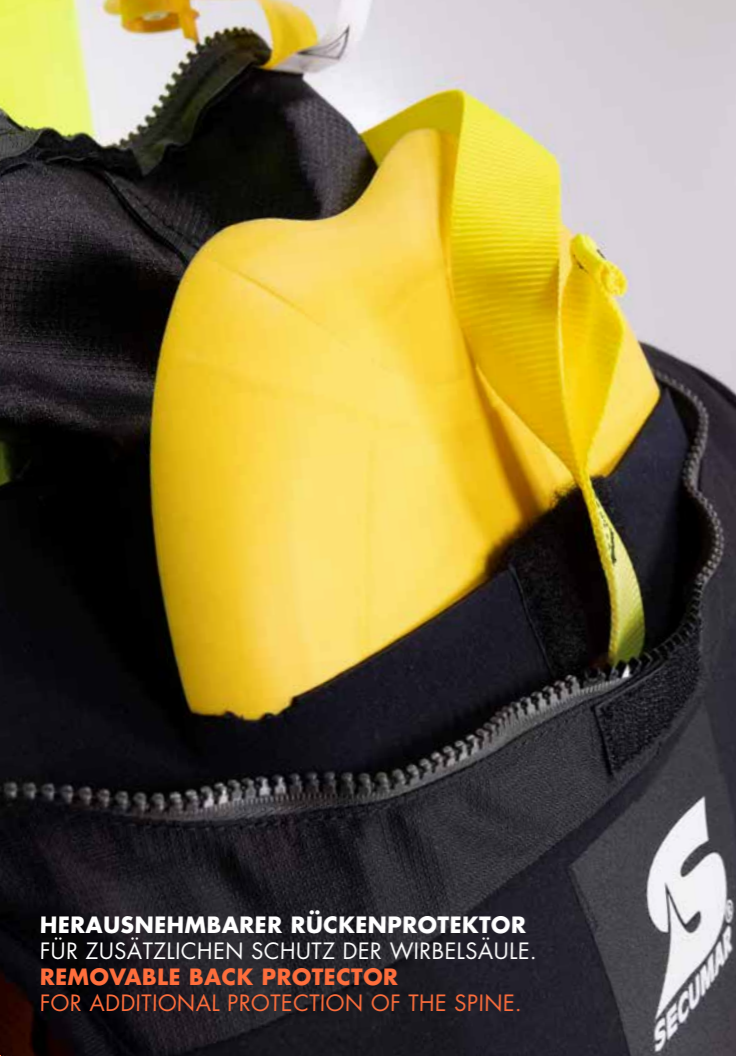
HERAUSNEHMBARER RÜCKENPROTEKTOR FÜR ZUSÄTZLICHEN SCHUTZ DER WIRBELSÄULE. REMOVABLE BACK PROTECTOR FOR ADDITIONAL PROTECTION OF THE SPINE.